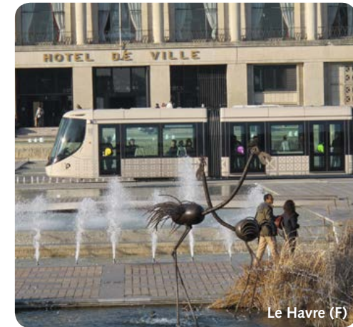
Le Havre (F)