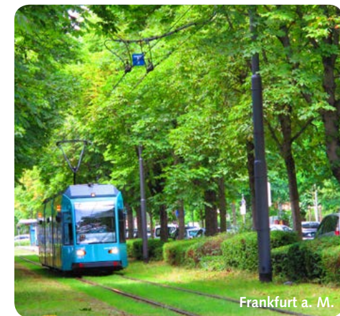
Frankfurt a. M.